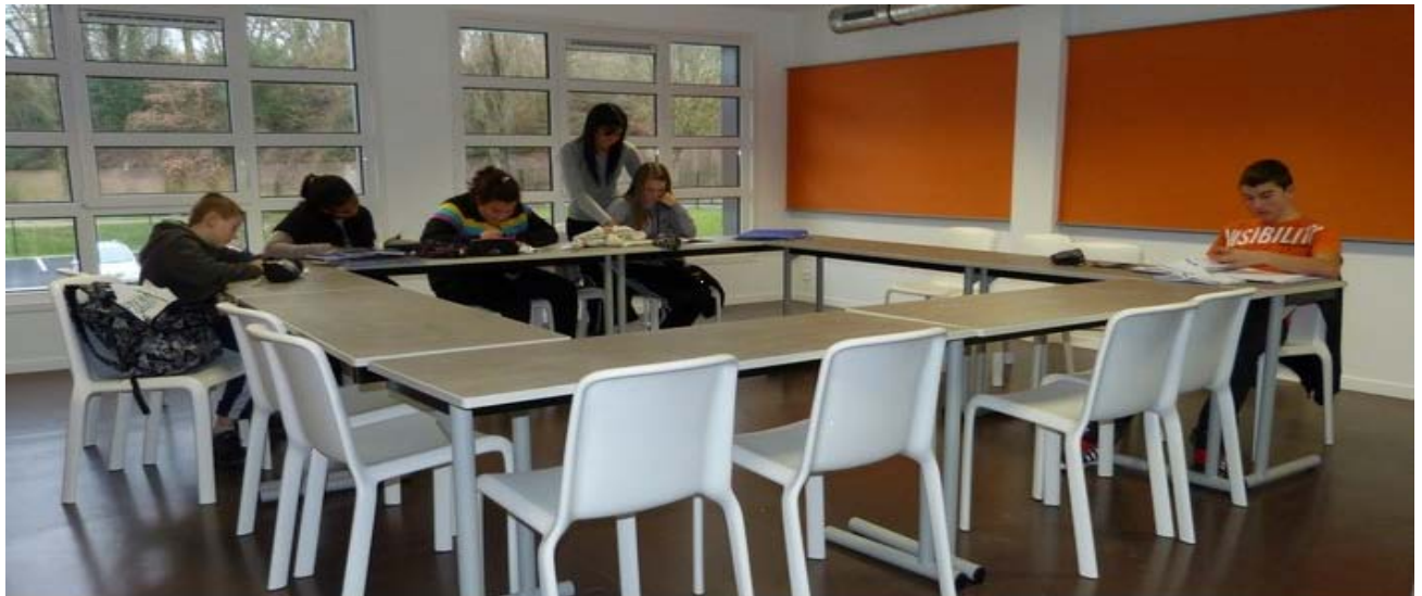
Internat d'excellence - salle de travail