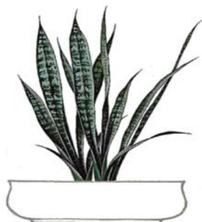
Association Sansevieria Martinique